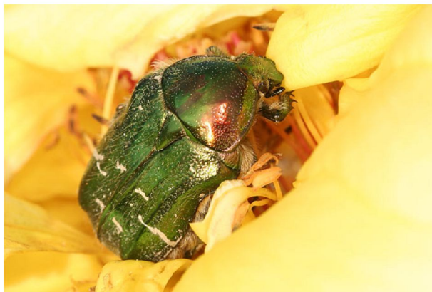
Rosenkäfer an Gartenrose

Insekten bestäuben unsere Pflanzen auf der Suche nach Nahrung. Blüten und Insekten haben sich deshalb im Laufe der Evolution aneinander angepasst. Manche Blüten können sogar nur von bestimmten Insektenarten bestäubt werden.