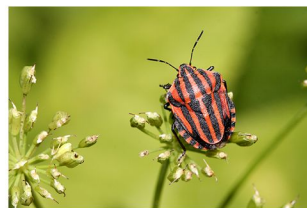
Streifenwanze auf Doldenblütler

Wanzen haben einen kurzen, ausklappbaren Rüssel und fliegen vor allem gut zugängliche Blüten an. Knöterich- und Ampfersorten gehören zu ihren Vorlieben. An diesen legen sie auch gern ihre Eier ab. Die nächste Generation sitzt damit gleich an der richtigen