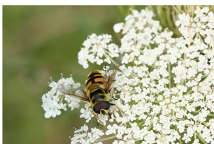
Schwebfliege auf Doldenblütler

Blüten besuchende Arten brauchen unterschiedliche Blütenformen. Während Schwebfliegen Nektar konsumieren und möglichst oöen zugängliche Blüten suchen, fliegen Aasfliegen sehr spezielle Blüten an, um dort ihre Eier abzulegen. Schwebfliegen haben kurze und