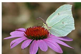
Zitronenfalter auf Purpursonnenhut - Foto: NABU/Hubertus Schwarzentraub

Tagfalter saugen Nektar aus tiefen, langen Blütenröhren, die Bienen und Fliegen nicht erreichen können. Oft liegt der Nektar in den meist aufrechten Blüten bis zu 4 cm im Inneren der Blüte verborgen. Favorisierte Farben sind Rot, Blau oder Gelb. Die Farbmale locken die Insekten zu ihrer Nahrungsquelle in