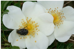
Rosenkäfer auf Bibernellrose

Käfer werden als erste Bestäuber der Erdgeschichte angesehen. Blüten besuchende Käfer fressen vor allem Pollen, da der Nektar für ihre kurzen, beißenden Mundwerkzeuge oð zu tief verborgen ist. Sie sind deshalb auf gut zugänglichen, oöenen, pollenreichen Blüten zu finden wie